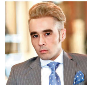
王士维 (Alexander Wong) 王士维建筑师事务所的创始人

项目:阿凡达城(中山五月花电影城) 类别:主题电影院(Avatar City 阿凡达城) 地点:广东中山市棕榈彩虹花园商业中心 建筑面积:3,420 平方米 竣工:2013 年 12 月