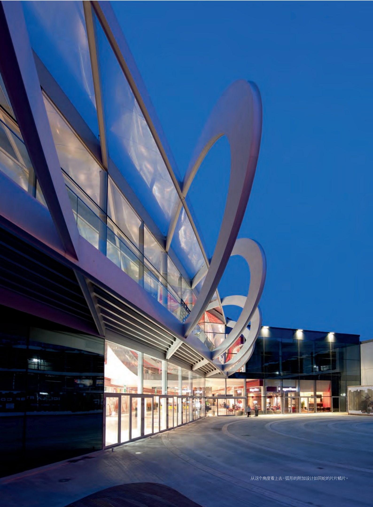
从这个角度看上去，弧形的附加设计如同蛇的片片鳞片。