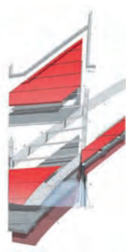
设计草图清晰地表现出了设计师Ron Arad简洁精细的设计风格。