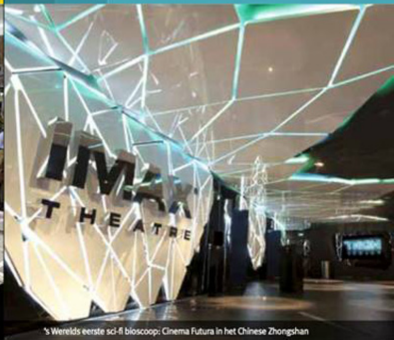
's Werelds eerste sci-fi bioscoop: Cinema Futura in het Chinese Zhongshan