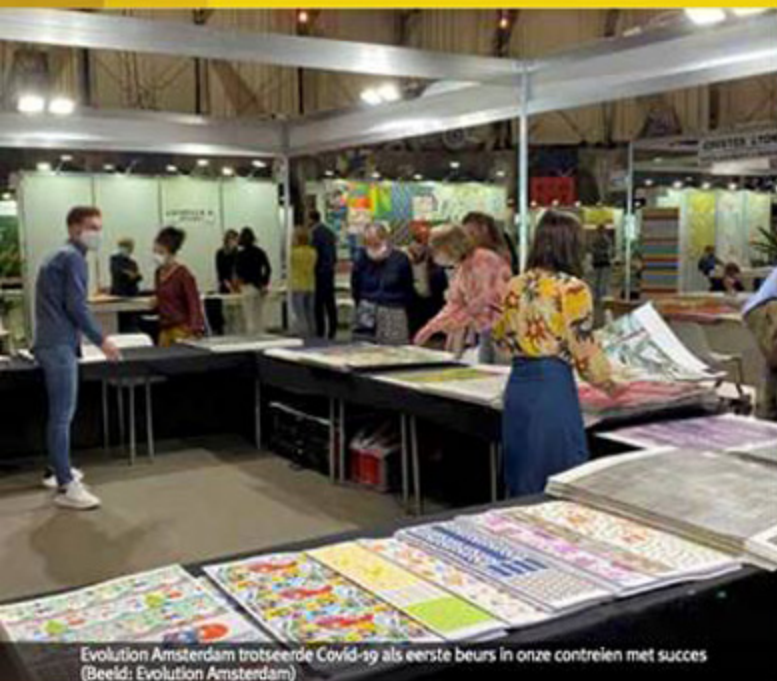
Evolution Amsterdam trotseerde Covid-19 als eerste beurs in onze contreien met succes