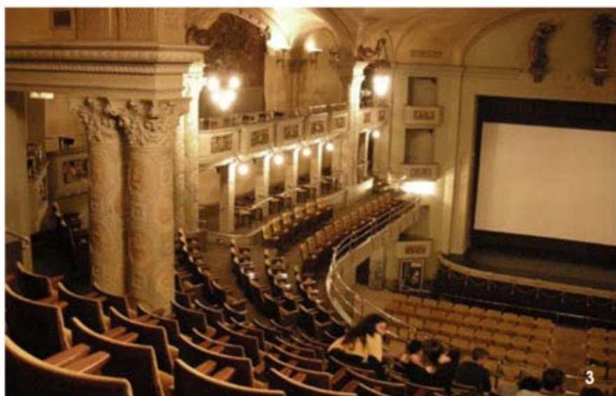
1/2.位于香港尖沙咀的国际广场ISQUARE影院与屯门同属于UA院线,且均为主题性展开,但前者走的是超现实梦境路线,后者则是古典高雅 3.在欧洲,仍然保留了不少拥有悠久历史、古典主义风格、宛如剧场一般的老式电影院 4.王士维设计的香港太古广场电影院犹如一座现代艺术博物馆 5.《阿凡达》之后,IMAX逐渐进入人们的视野,有没有配备IMAX放映系统也已逐渐成为判断影院水准的一个标志