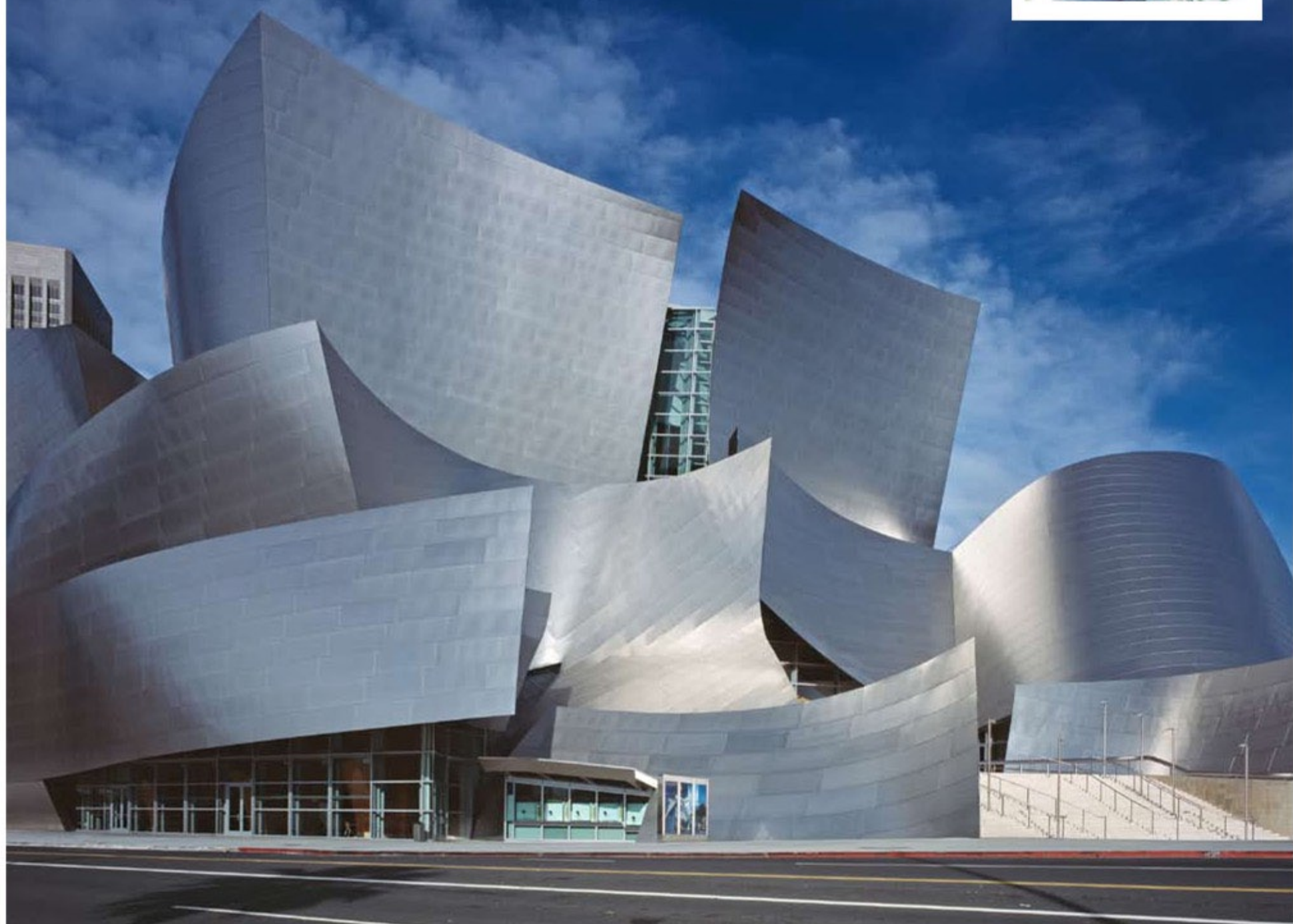
弗兰克·盖瑞 (Frank Gehry) 设计的洛杉矶迪士尼音乐厅 (Walt Disney Concert Hall)