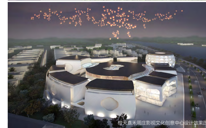
橙天嘉禾周庄影视文化创意中心设计效果图