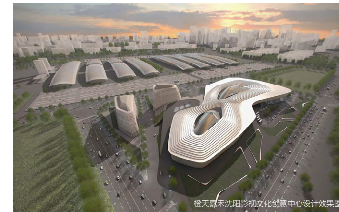
橙天嘉禾沈阳影视文化创意中心设计效果图