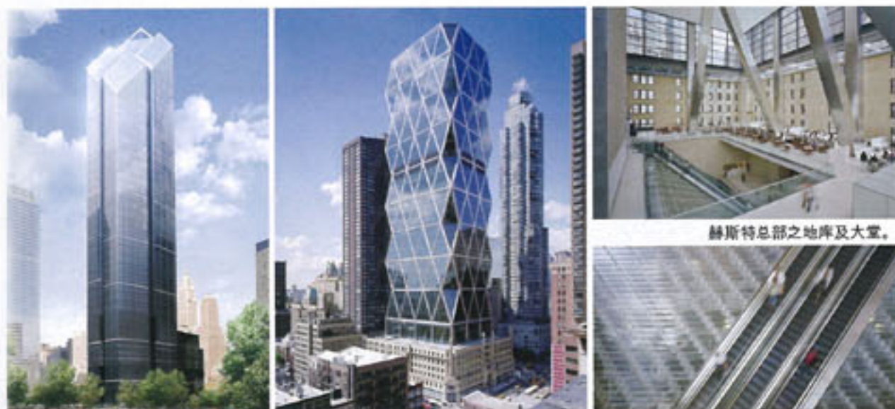
格林威治街200号的外观。